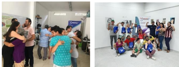
Fuente: Sensibilización frente a violencia de género (izq) y taller autoesquemas y proyecto de vida (der)