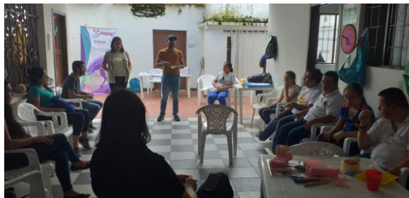
Fuente: Acompañamiento y orientación durante jornada elección representantes sociedad civil Comité de Discapacidad Lebrija.

Las jornadas de elección de representantes de la sociedad civil se llevaron a cabo entre el 02 y 06 de diciembre y los representantes de la sociedad civil fueron posicionados a través del Decreto No 116 de 09 de diciembre de 2019.