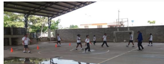
Fuente: Sesiones de entrenamiento en Puerto Wilches y Lebrija

En el mes de diciembre se programa el primer encuentro deportivo del proyecto con los participantes de los dos municipios.