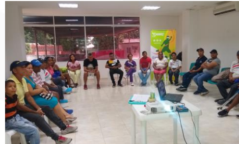
Fuente: Socialización convocatoria elección representantes sociedad civil Comité Municipal Discapacidad

Sogamoso y una capacitación en estructura y funcionamiento del Sistema Nacional de Discapacidad, con énfasis en Comités Municipales de Discapacidad.