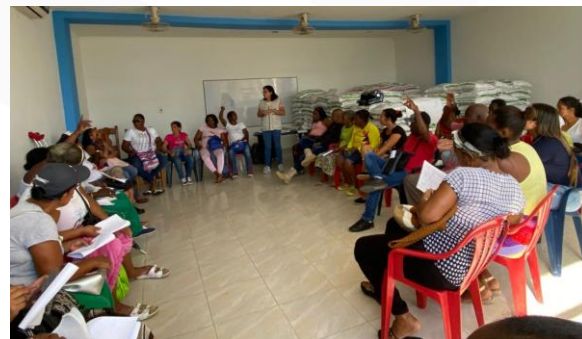
Fuente: Orientación en asamblea de conformación de organización de personas con discapacidad de Turbo

La organización se ha conformado siguiendo los lineamientos del Decreto 1350 de 31 de julio de 2018, del Ministerio del Interior. El proceso de inscripción ante la Dian y Cámara de Comercio se llevará a cabo al iniciar el año 2020.