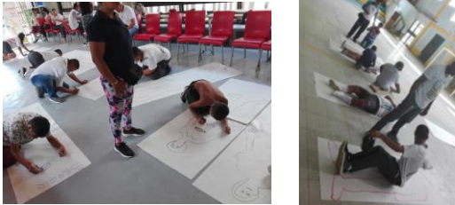
Fuente: Taller proyecto de vida y autoesquemas en Dabeiba (izq) y Turbo (der)